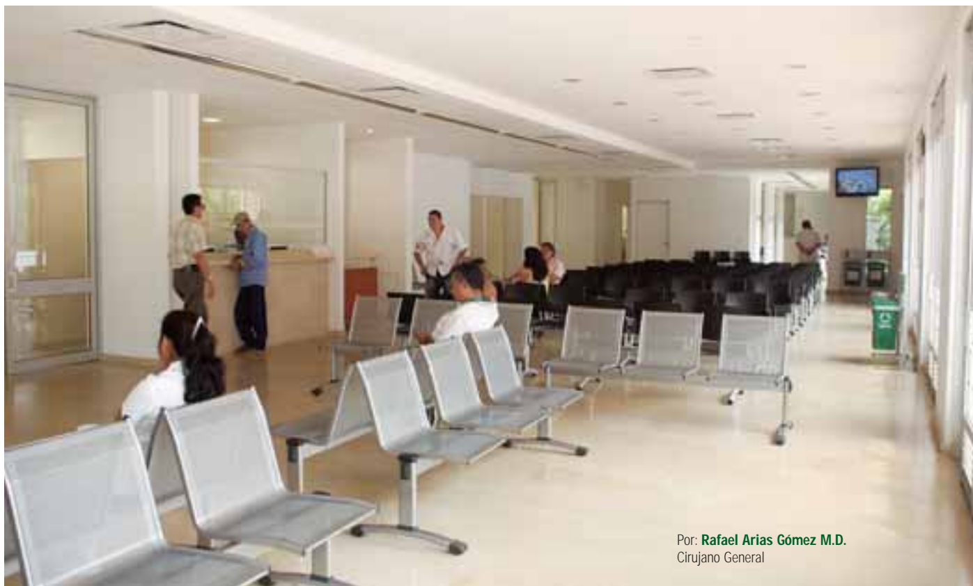
Por: Rafael Arias Gómez M.D. Cirujano General

Una atención oportuna, respaldada por la seguridad, la comodidad y con elevados estándares de calidad médica y tecnológica, son algunas de las características más notables que Servicio de Urgencias que la Fundación Valle del Lili ofrece a la comunidad. Es así como en la reciente ampliación de su capacidad se destacan la belleza de sus instalaciones, la amplitud de sus espacios, y sobre todo, el fortalecimiento de sus recursos científicos y tecnológicos, que continuarán logrando el propósito de reducir los tiempos de espera de las personas que confían la atención de su salud a la Institución.