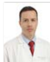
Por Dr. William Martínez • Neumólogo