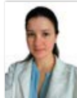
Por Dra. María Angélica Aristizabal •Psicóloga Clínica