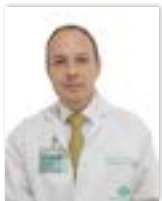
Por Dr. Rodrigo Polanía • Oftalmólogo Pediatra - Estrobólogo