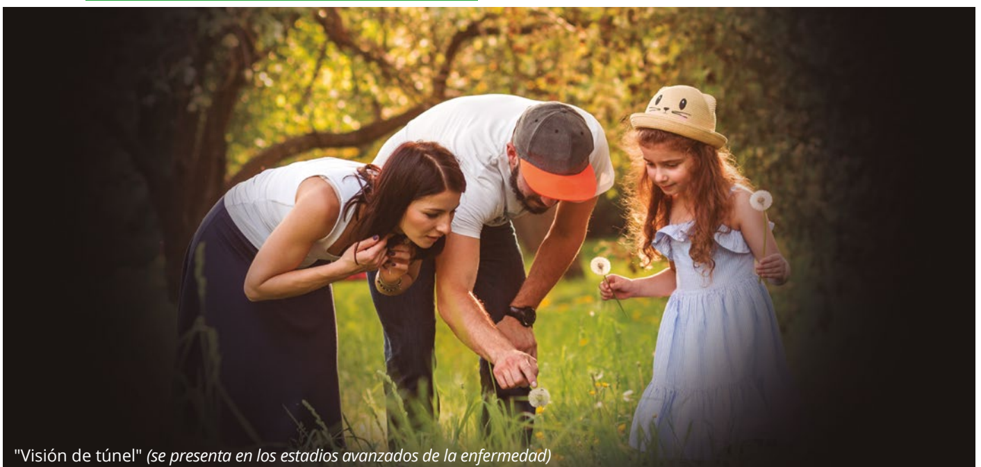
"Visión de túnel" (se presenta en los estadios avanzados de la enfermedad)

El glaucoma comprende un grupo de enfermedades que afectan el nervio óptico de forma específica, progresiva e irreversible, que conduce a la ceguera si no se trata.